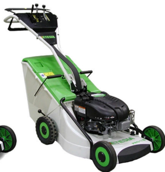
PRO 51K TU 51 E